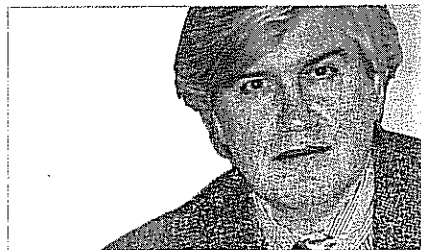
Werner Klumpe Rechtsanwälte Klumpe, Schroeder + Partner, Köln

achtung eines Dritten kann die eigenen Pflichten des Vermittlers/Beraters nicht ersetzen. Er muss sich selbst fachkundig machen. Unserer Ansicht nach kann ein solches Gutachten den Vermittler/Berater nicht entlasten. Ein Schadensersatzanspruch des Kunden gegen den Vermittler/Berater besteht im Falle einer Pflichtverletzung und eines Verschuldens. Gerade im Hinblick auf die zweifelhafte Rolle von Rating-Agenturen und deren geschönte Analyse aufgrund des Auftragsverhältnisses zu dem zu begutachtenden Unternehmen dürfte sich kein Vermittler/Berater darauf berufen können, dass er sich auf eine Rating-Analyse verlassen habe.